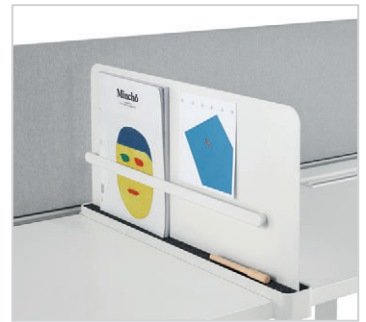
Séparateur de bureau ultra fin avec pince à documents