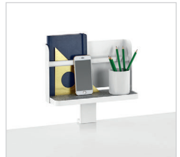
Étagères avec fond