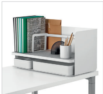
Organiseurs de bureau