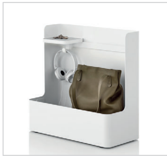
Rangement mobile pour sac à main